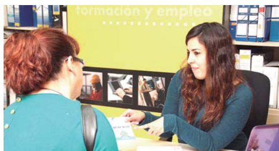
Orientación a mujer con discapacidad / CLM ACTIVA

La participación de la mujer con discapacidad en el mercado de trabajo, a pesar de los tímidos avances producidos, sigue presentando una “desoladora instantánea”, tanto si la