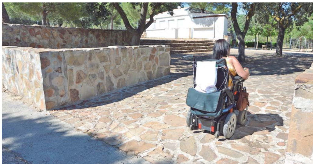
Senderos en La Atalaya / MJG

Hablar de ocio inclusivo implica desarrollar actividades recreativas y lúdicas en las que cualquier persona tenga cabida, sean cuales sean sus características, y para ello es imprescindible promover la accesibilidad universal y contar con profesionales expertos en discapacidad que puedan dar respuesta a las necesidades de cada persona. "Todo ser humano tiene derecho a disfrutar de su tiempo libre, de su ocio, de sus aficiones, en definitiva, de hacer lo que les guste. Por eso, desde Cocemfe Ciudad Real y por medio de artículos como éste, tratamos de promoverlo, solos o con la participación de personas sin discapacidad, convencidos de que compartir ese tiempo libre es siempre enriquecedor para todos".