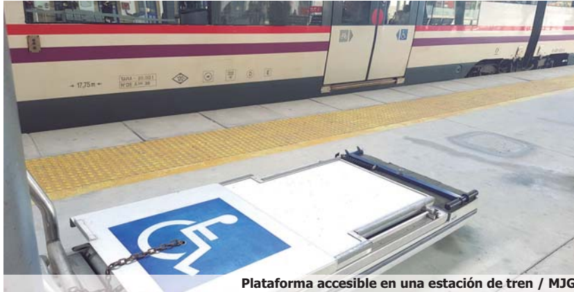
Plataforma accesible en una estación de tren

Montón hizo este anuncio en su comparecencia en la Comisión de Sanidad, Consumo y Bienestar Social del Congreso de los Diputados, donde recalcó que el desarrollo de este plan "irá de la mano, de manera especial, con el Cermi y la Fundación ONCE".