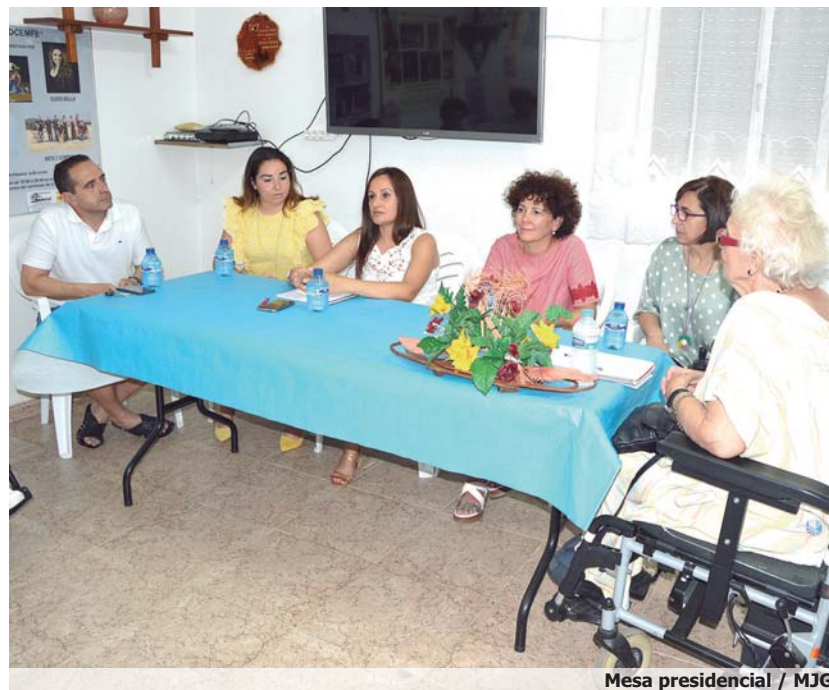
Mesa presidencial

En este sentido, la directora provincial de Bienestar Social les transmitió un mensaje a todos los familiares que tienen