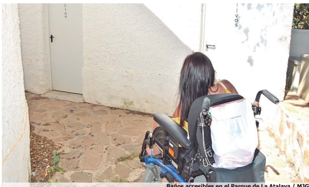
Baños accesibles en el Parque de La Atalaya