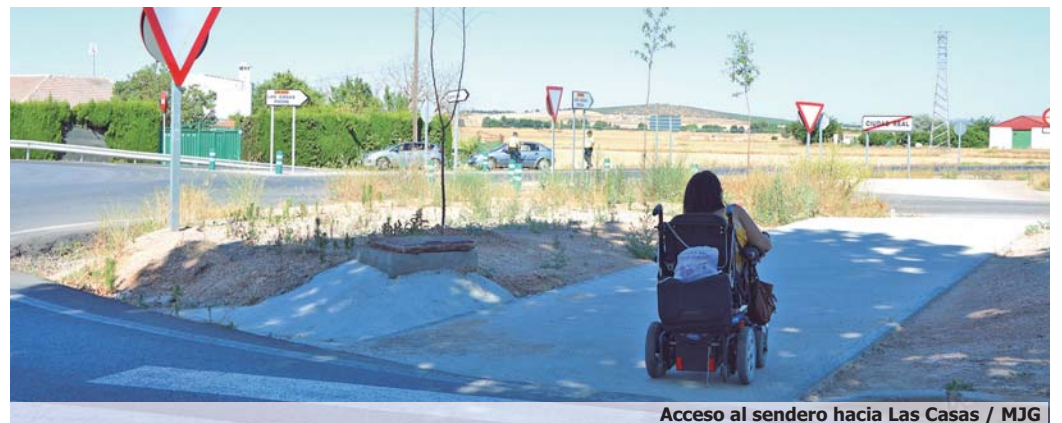
Acceso al sendero hacia Las Casas

De este modo, Cocemfe Ciudad Real constató la mejora de algunas de las salidas de la ciudad, en concreto, la calle Gregorio Marañón que da acceso a la primera de las rutas adaptadas, un camino hacia la pedanía de Las Casas, a escasos cinco kilómetros de la capital. "La calle Gregorio Marañón ha mejorado notablemente con diversas actuaciones encaminadas a mejorar la accesibilidad, eliminando barreras para personas con diversidad funcional y adaptando otras como