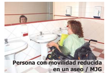
Persona con movilidad reducida en un aseo

En cuanto a qué tipo de problema es el que dificulta las actividades de la vida cotidiana, el 83,41% manifestó que se