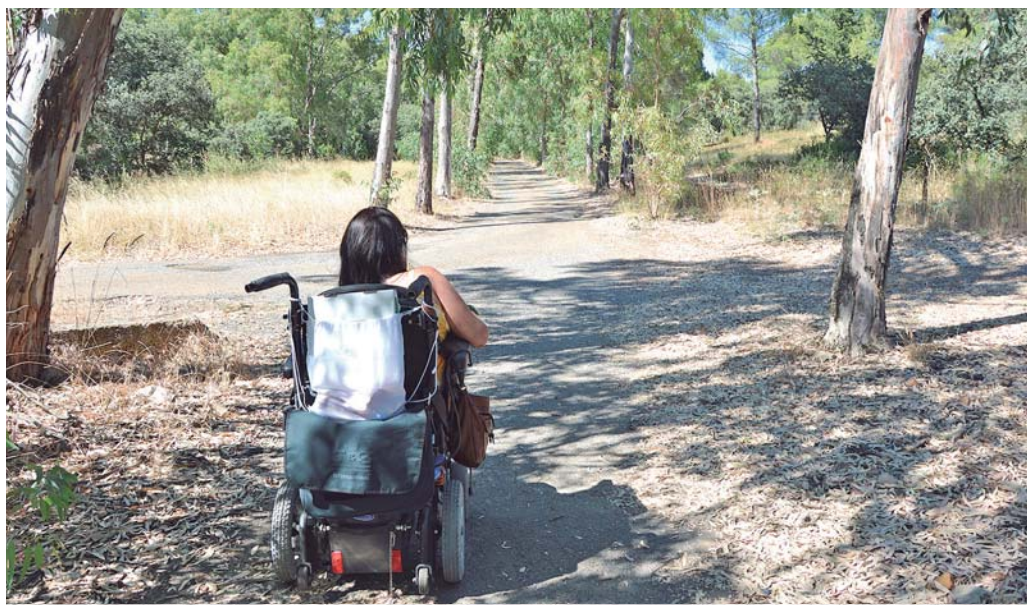
Acceso al Parque de La Atalaya / MJG