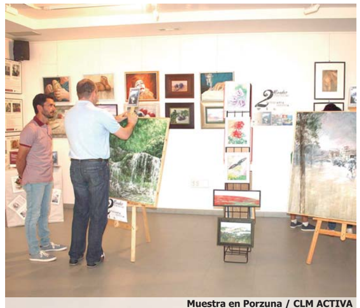
Muestra en Porzuna / CLM ACTIVA

Por otro lado, dentro de los actos programados de cara a los mayores del municipio, el Ayuntamiento quiso tener una deferencia con aquellos que llevan toda una vida haciendo crecer Porzuna. Fue en un acto muy emotivo donde se hizo entrega de una placa y flores a la tercera edad porzuniega. Tras ello, la música fue la protagonista, y faltaron manos en la Playa Mayor para aplaudir a la Coral Nuestra Señora del Rosario. El grupo dejó boquiabierto al público con canciones de hasta 4 países diferentes; África, EEUU, Francia y por supuesto España se trasladaron por un momento al centro de la localidad ciudadrealeña. Pero la música no se apagó con el fin de la