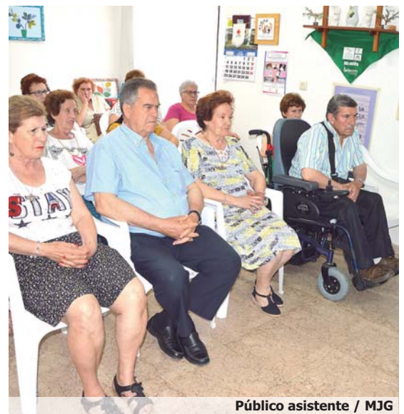
Público asistente / MJG

Los participantes se interesaron igualmente por las polí-