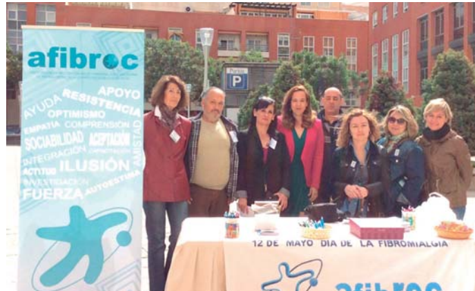
Imagen de archivo. Afibroc. Cuestación en Ciudad Real