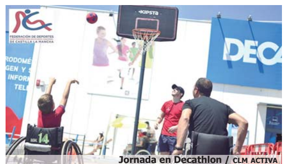
Jornada en Decathlon / CLM ACTIVA