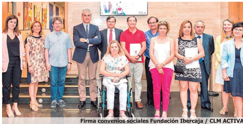
Firma convenios sociales Fundación Ibercaja / CLM ACTIVA

La convocatoria tiene la finalidad de respaldar iniciativas que fomenten la empleabilidad de las personas en situación o riesgo de exclusión social como desempleados de larga duración, personas con discapacidad, sin hogar o con problemas de adicción, y otros colectivos en dependencia social. Además, han sido objeto de ayuda aquellos proyectos orientados a cubrir las necesidades básicas de alimentación, higiene y acogida, así como los proyectos destinados a implementar alternativas que afronten el fracaso escolar. También se ha prestado especial atención a actividades, talleres o programas