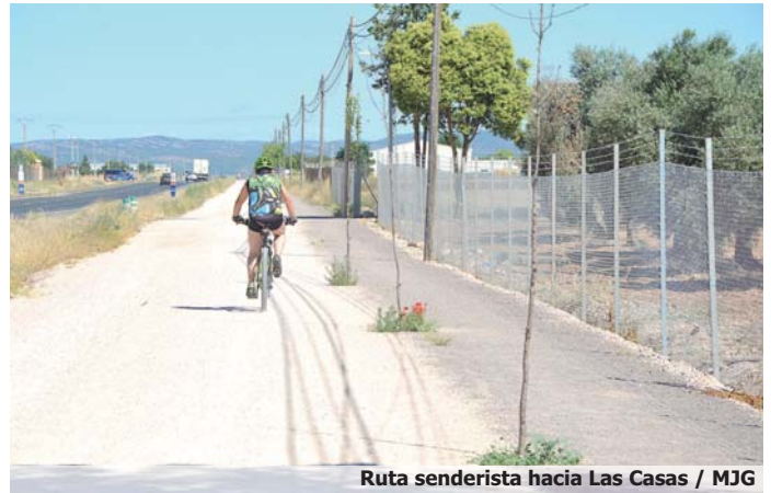
Ruta senderista hacia Las Casas