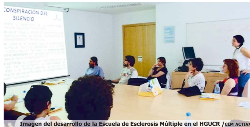
Imagen del desarrollo de la Escuela de Esclerosis Múltiple en el HGUCR / CLM ACTIVA

nicos aportando diferentes puntos de vista de la enfermedad y los cuidados que requiere, añade Mayoral.