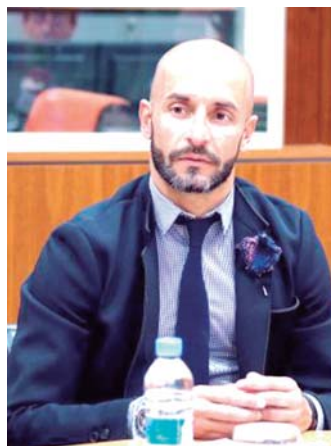
Jesús Celada / SERVIMEDIA

Celada ha sido miembro del jurado de los Premios Reina Le-