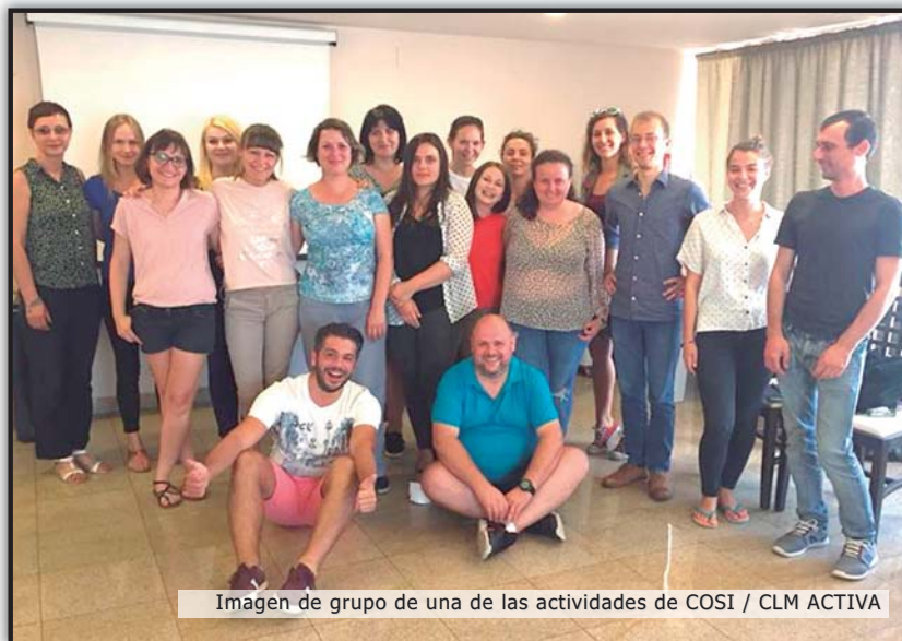
Imagen de grupo de una de las actividades de COSI / CLM ACTIVA

Además, logramos implementar 6 acciones de ayuda humanitaria con un grupo objetivo total de 374 personas tales como: personas sin hogar que vi-