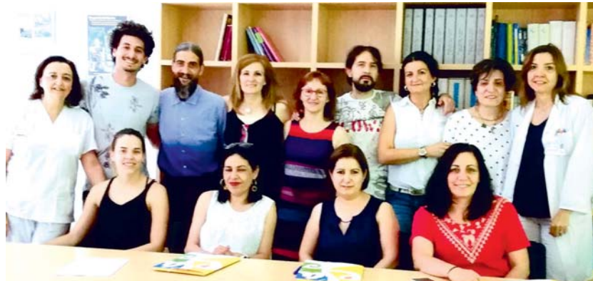
Imagen del desarrollo de la Escuela de Esclerosis Múltiple en el HGUCR / CLM ACTIVA

El papel de la Enfermería y de los pacientes expertos permite intercambiar experiencias y conocimientos científico-téc-