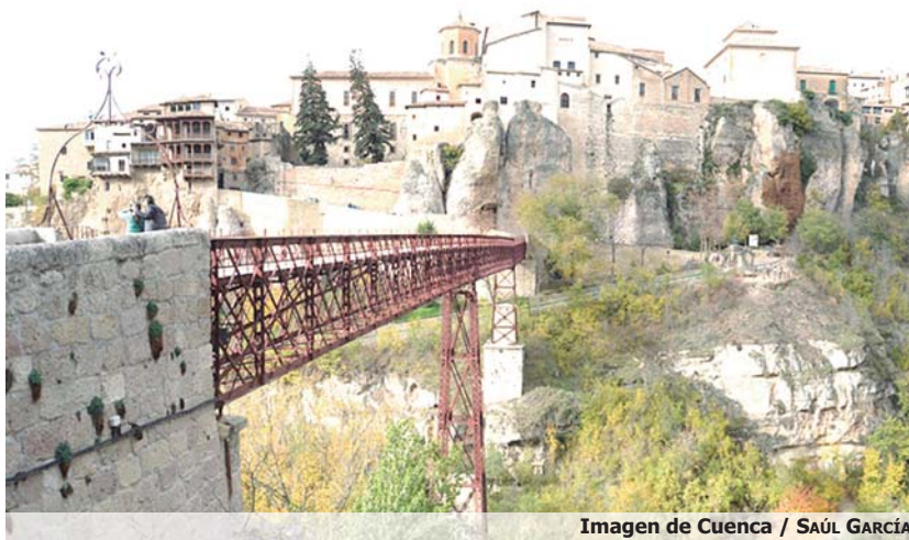
Imagen de Cuenca

En este sentido, en la misiva se reclama a la Junta que en la firma del protocolo de actuación se detalle, entre otras cosas, el coste total del proyecto y qué aportación tendría que asumir el Ayuntamiento. Asimismo, el regidor reclamó más información