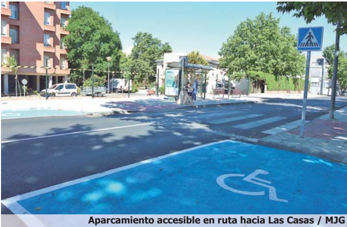
Aparcamiento accesible en ruta hacia Las Casas