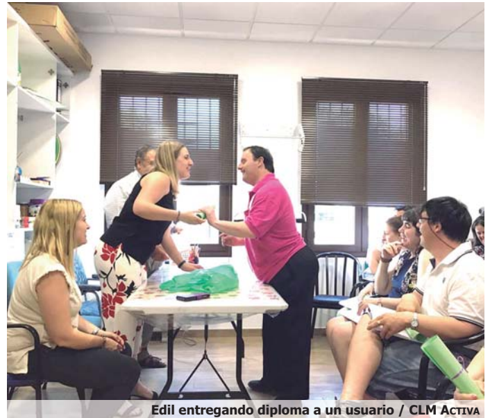
Edil entregando diploma a un usuario / CLM Activa

Amfisa aprovechó también el cierre de la temporada para hacer balance de dichas áreas. El servicio de terapia ocupacional ha acogido este año a quince usuarios y ha trabajado por mantener la autonomía personal y haciendo hincapié en el fomento de las actividades básicas de la vida diaria. El de logopedia congregó a catorce usuarios, sirviendo de garantía para la plena inclusión en la sociedad, puesto que los beneficiarios presentan dificultades relacionadas con el lenguaje, el habla y la