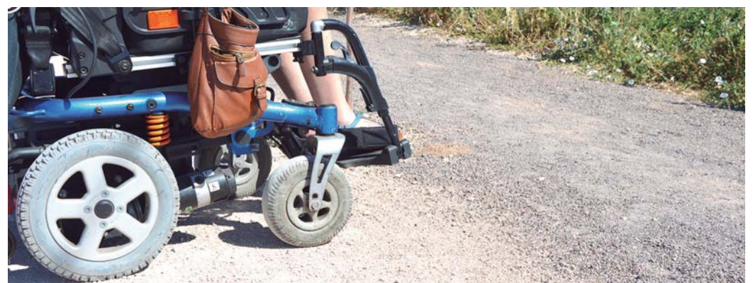
Diferente asfaltado. Camino hacia Las Casas / MJG

acerado, con sus correspondientes rebajes, o aparcamientos reservados próximos tanto a paradas de autobuses, como a las residencias asistenciales que en esta manzana de Ciudad Real existen". Mención aparte merece el último tramo de esta calle y su confluencia con la calle Oretana. Las